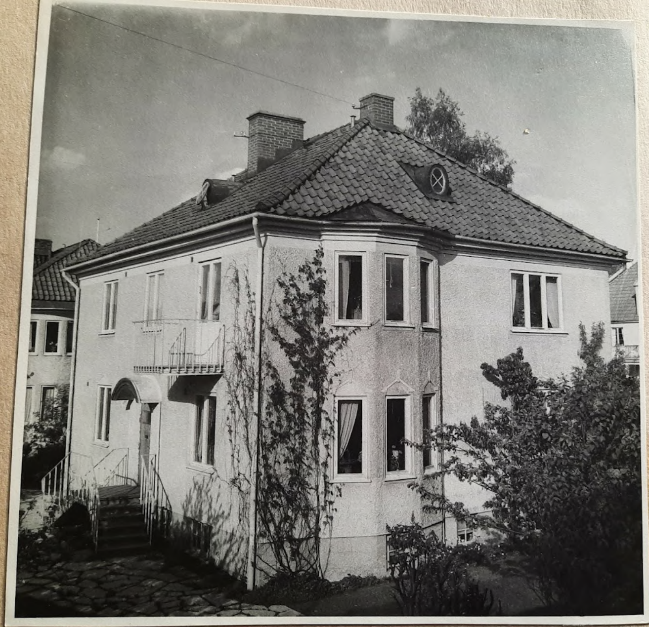
Den Givrlige gästgården