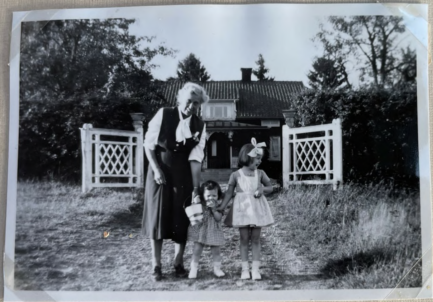
Farmor o glickorus