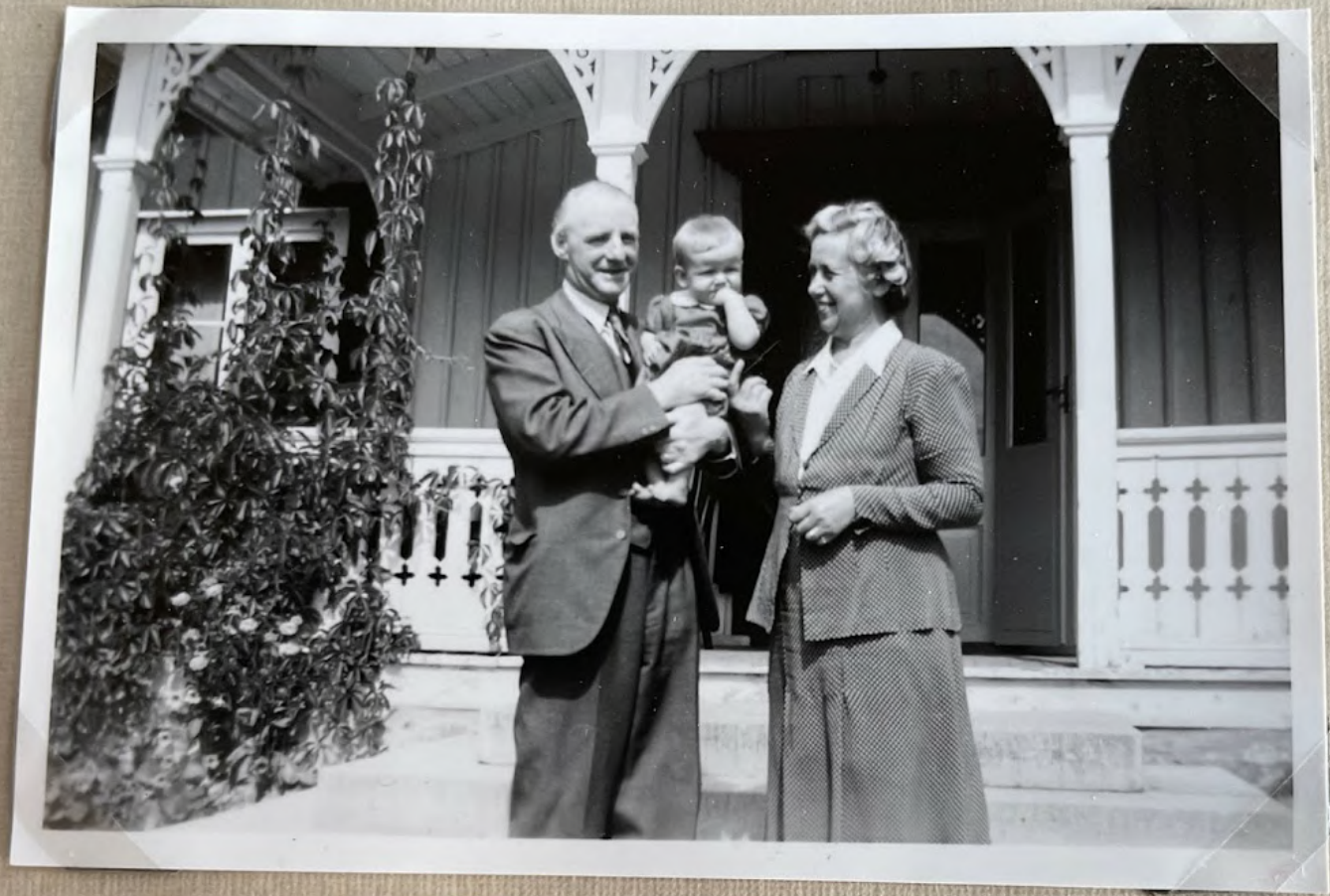
Med Farmor och Farfar 1 aug. 1943.