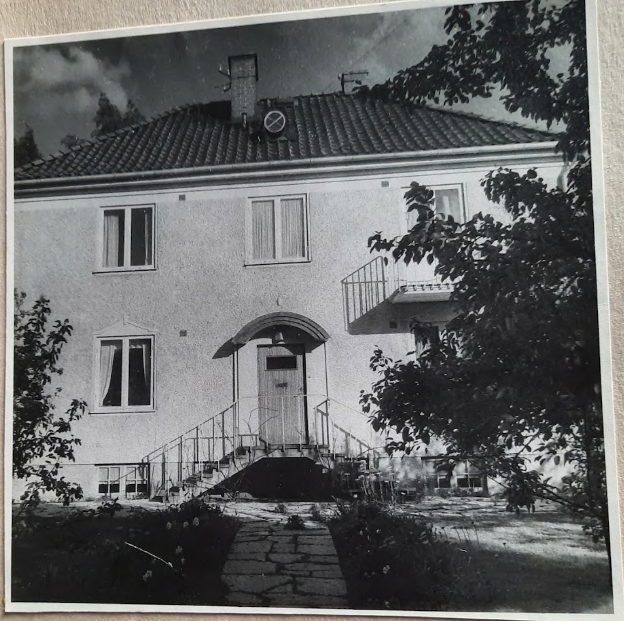
← Nelsonsg 3