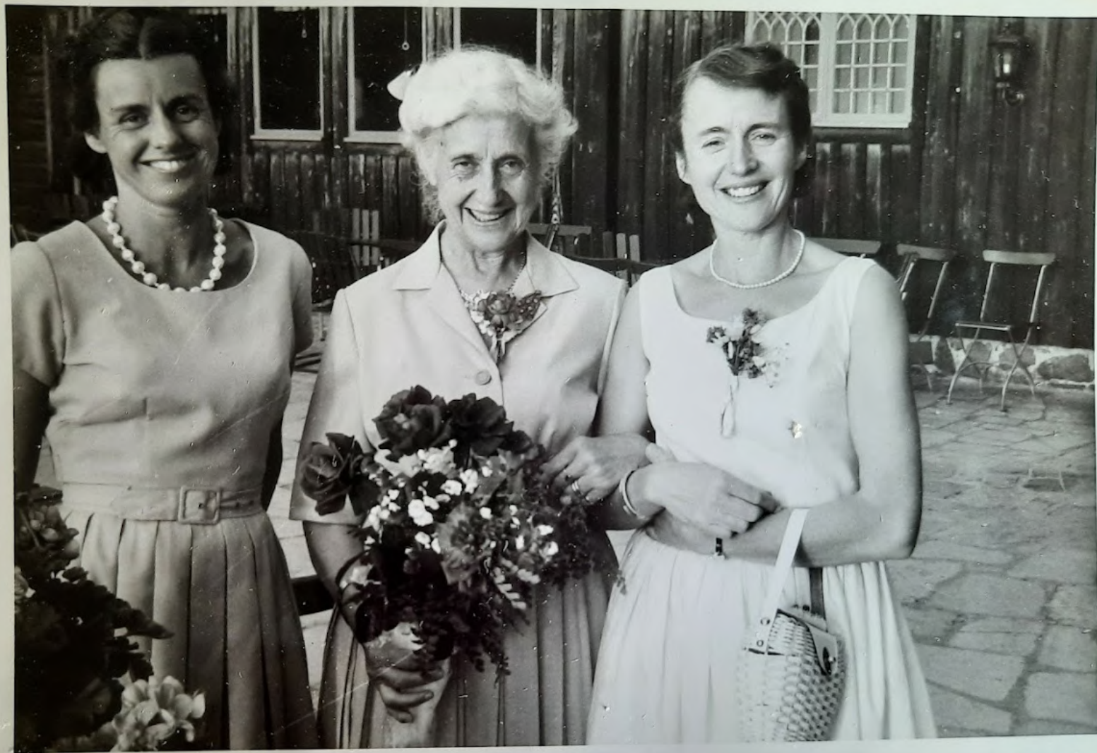
Mor med døttar