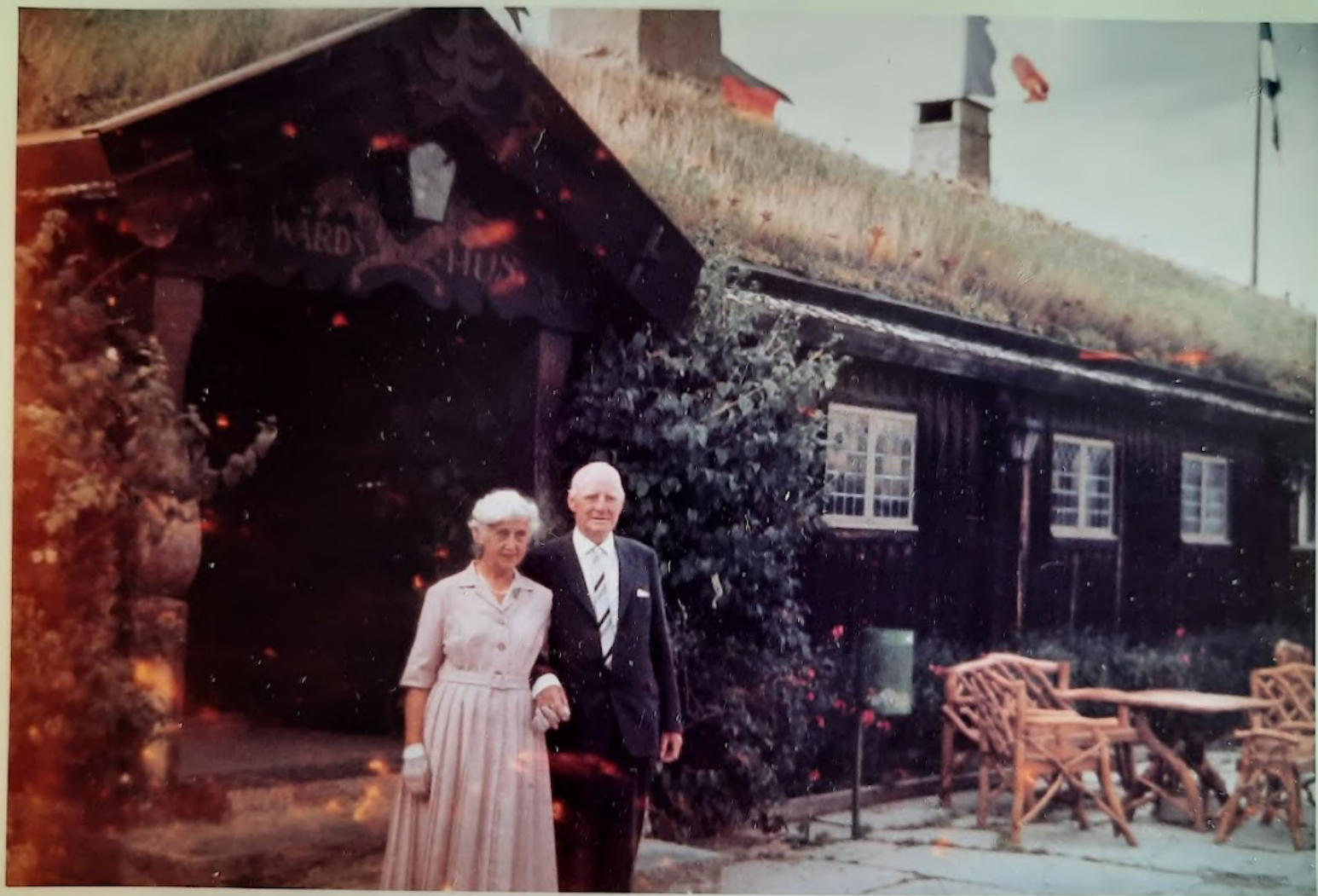
Väst underbara guldbröllopp . Gyllene Udden 29 juli 1968.