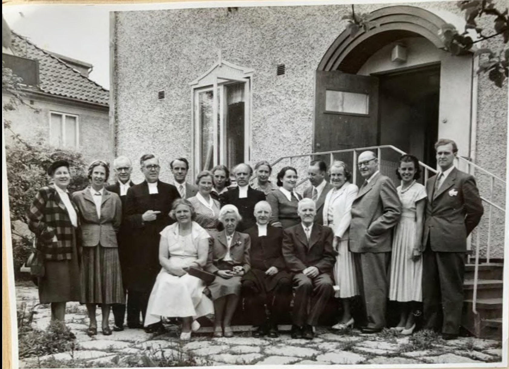
Melinare med tillbehör